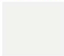
cuolo bianco white leather